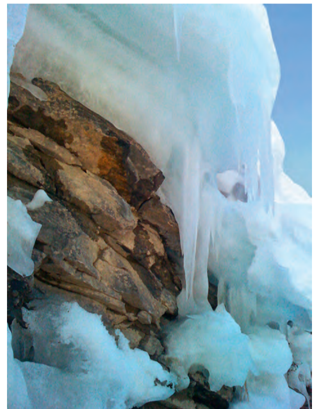
Bizarre Eisfelsen.