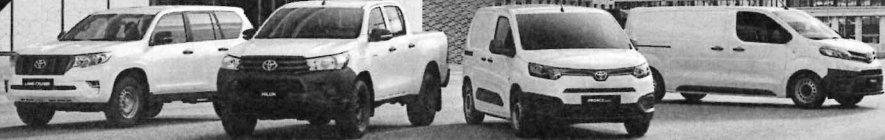
LAND CRUISER PROFI Bedingungslos geländetauglich